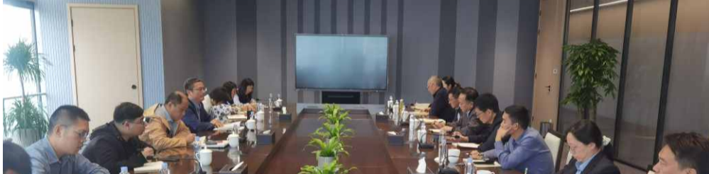
△集团党委召开主题教育推进会

9月15日，集团党委第一时间召开党委扩大会议，传达学习贯彻党中央、省委和市委部署要求，及时成立主题教育工作领导小组，下设办公室具体负责主题教育相关工作，各基层党组织成立相应的领导小组和办公室，制定集团党委主题教育工