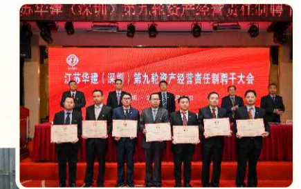
江苏华建（深圳）第九轮资产经营责任制考核

公司将人才引进培养放在突出位置来抓，针对专业人才紧缺、人才培养断档、人员年龄老化等问题，实施“1234”人才规划，通过“英才计划”