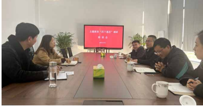
△集团赴江都区郭村镇邳州村调研村企共建

深入调查研究谋新路。集团领导班子每人领受一个重点课题开展调研，坚持把调研报告写在项目里、写在线上，深入分管领域、基层一线、重点项目以及所联系的党支部等开展调研。力争通过真调研、真调研，打通集团高质量发展的堵点，消除集团高质量发展的痛点，接通集团高质量发展的断点。