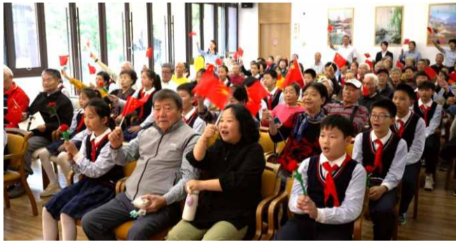
△集团天瑞公馆老少同唱《没有共产党就没有新中国》

恪守为民服务办实事。集团秉持“好房子、华建造”的为民服务理念，深入推进供给侧结构性改革，锁住客户，满足人民日益增长的美好生活需要；在天璟融园项目打造学习教育进工地党建文化广场，开展扬州首家完整居住社区、低碳社区试点；在天瑞公馆养老社区丰富活动载体，为老年党员送教上门，让社员老有所学、老有所养、老有所乐，天瑞公馆联合东花园小学举办“赏菊登高觅秋色，老少同声颂党恩”的重阳节主题活动。集团积极推动村企联建，找准发力点，寻找增长点，做足红色文章、做出特色项目、做实产业对接，多次前往郭村镇邳州村开展实地调研，落细落实实施方案，着力把邳州村建设成为全市国有企业结对帮扶经济薄弱村的示范样板。