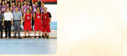
江苏华建深圳分公司“职工篮球赛”